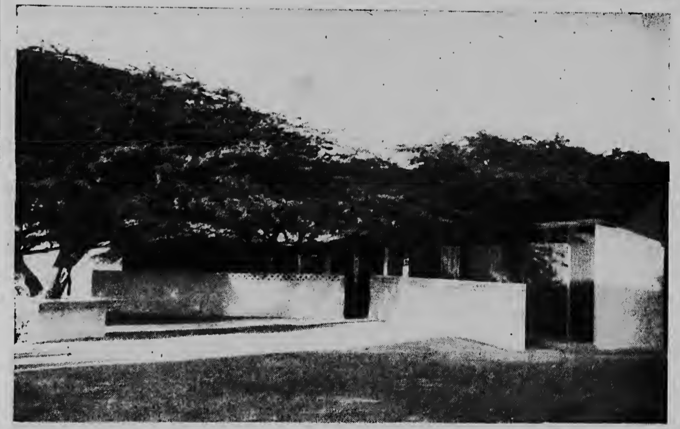
Dit zijn nu de veel omstreden badhokjes bij de Aruba Palm Beach.

Oranjestad: Leeszaal dagelijks van 9 tot 12 en van 2.30 tot 5.30; bovendien Dinsdag en Vrijdagavond van 7 tot 9 uur. Uitlen dagelijks van 2.30 tot 5.30 uur op Dinsdag en Vrijdagavond van 7 tot 9 uur. Zaterdagmiddag ook. Zaterdagmiddag: 10 tot 5 uur San Nicolas: Uitleen elke Dinsdag en Vrijdag